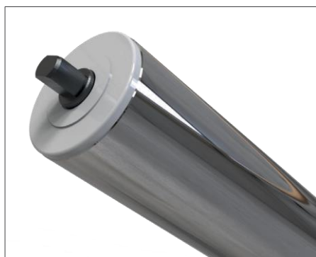
RS - 標準