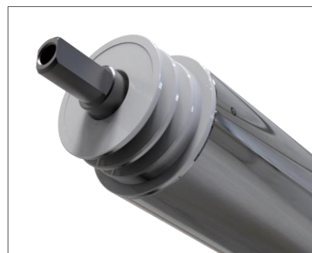
VP - V溝