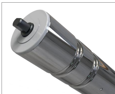
GT - 圓溝